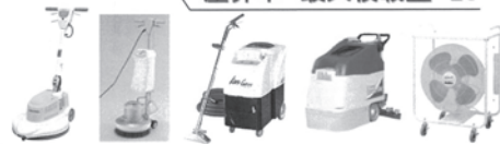
美装用品～プロ用フロアメンテナンス機器～