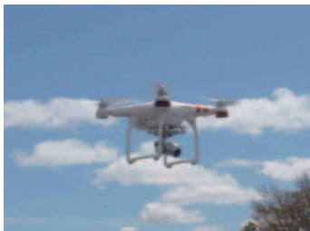
ドローンによる点検 ↑

当日は、天候もよく、建物の設備点検日（休館日）で、一般の利用者がいないということもあり、オーナー様のご理解をいただき実施することができました。