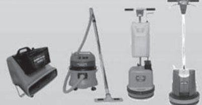
●コードレスブロー BL-24Li ●WetVac H-12Li ●BP-130Li/150Li

Allway Liコードレスマシンシリーズ バッテリー、充電器が共有できて便利!