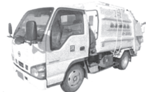
塵芥車 最大積載量 2t