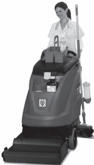
業務用自走式床洗浄機 BR 45/40 W Bp プレミアム