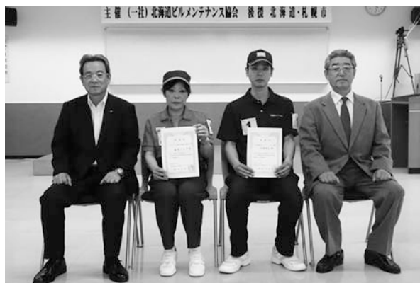
全国大会 北海道代表者