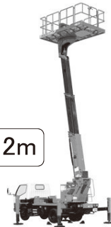
高所作業車 12m~40m 現場にあった機種をご用意致します！