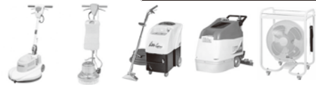
美装用品~プロ用フロアメンテナンス機器~