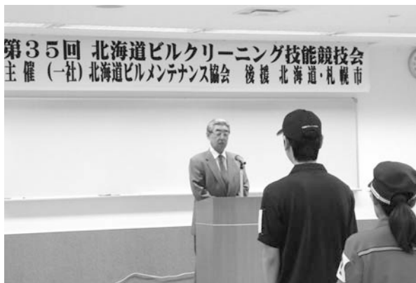
開会式 岡田会長挨拶