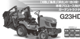
クボタ 乗用刈払機