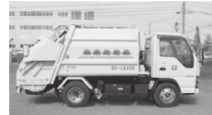
塵芥車 最大積載量 2t