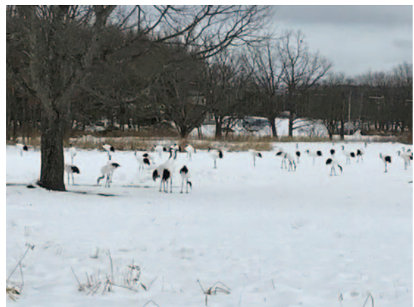
丹頂鶴のサンクチュアリ、鶴居村にある鶴見台での2枚