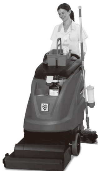
業務用自走式床洗浄機 BR 45/40 W Bp プレミアム