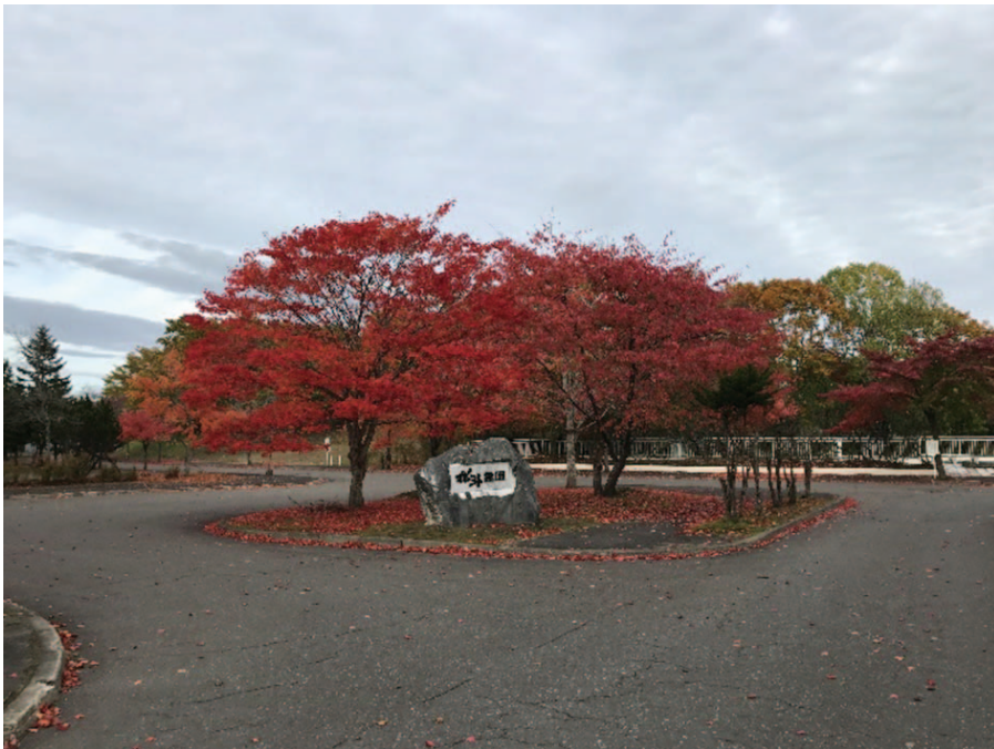
国立公園「釧路湿原」を一望する高台にある公園式墓地での一枚