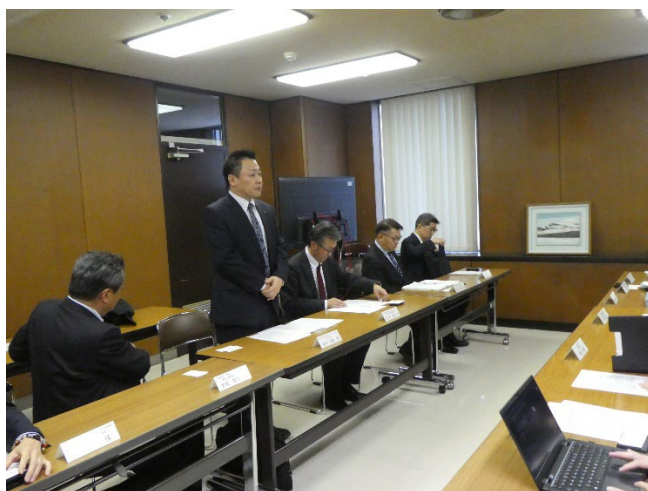
多田副会長の挨拶